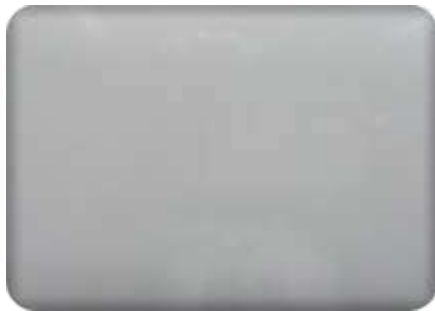
Ral 9006 gloss