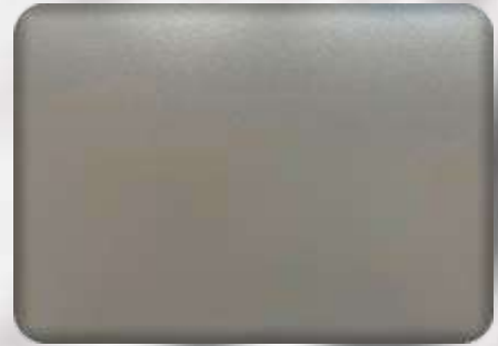
Ral 9007 matt