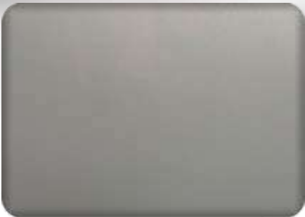
Ral 9006 FT