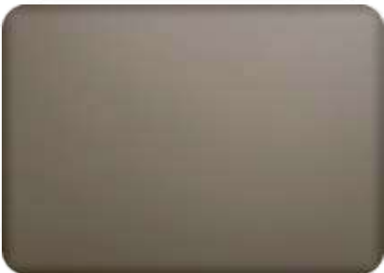
Ral 9007 FT