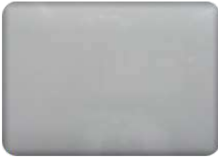
Ral 9006 gloss