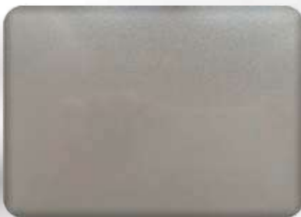
Ral 9007 gloss